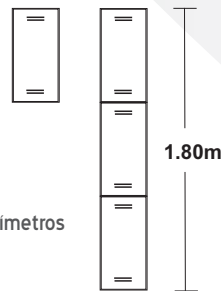
Locker de 3 puertas