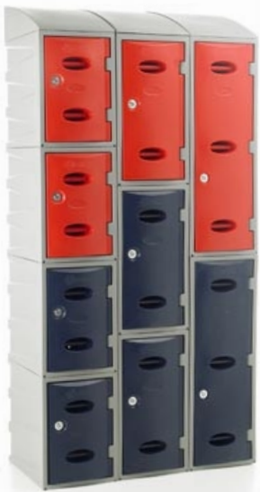
Locker de 2 puertas

El EPL se encuentra disponible en colores: gris marmoleado en cuerpos y azul rey, azul claro, blanco, negro y gris marmoleado en puertas. Pregunta también por las puertas fluorescentes que brillan en la oscuridad exclusivas de Mexicana de Lockers.